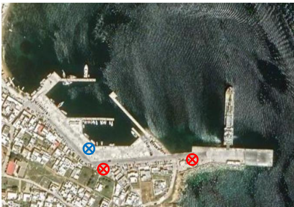
Εικόνα 5-12: Θέσεις ευκολιών υποδοχής στο λιμένα Λιβαδιού