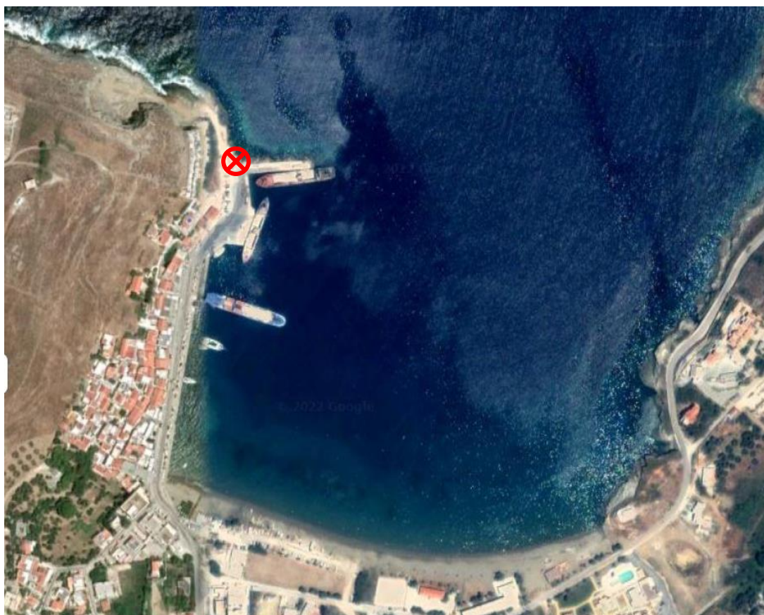
Εικόνα 5-10: Θέση ευκολιών υποδοχής στο λιμένα της Κορησιιάς