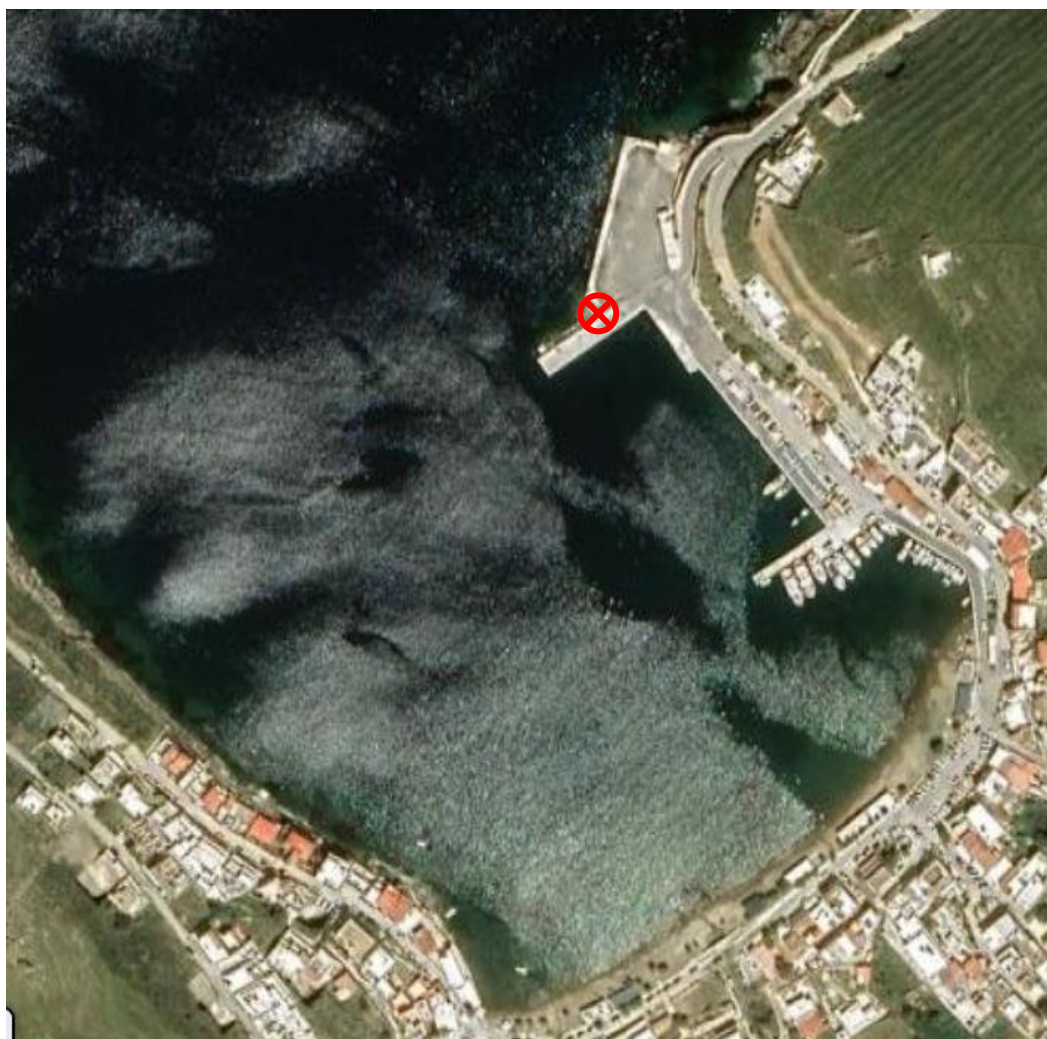
Εικόνα 5-11: Θέση σταθερών ευκολιών υποδοχής στο λιμένα του Μέριχα